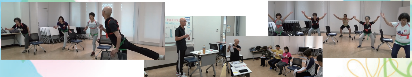
大身体操選手権 (二部リーグ) 銀メダル