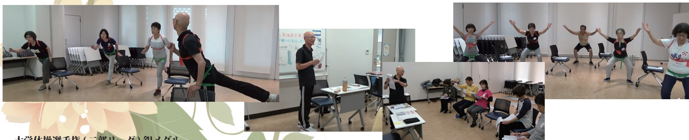
大身体操選手権 (二部リーグ) 銀メダル